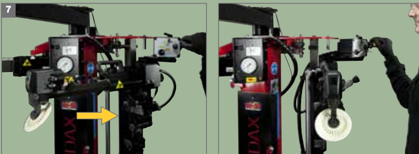
7. Gruppo Stallonatore - Movimento ad azionamento pneumatico di apertura laterale del braccio per consentire il posizionamento sul fianco inferiore Bead Breaker - Pneumatic lateral arm movement, allowing placement of bead breaker on bottom side of tyre