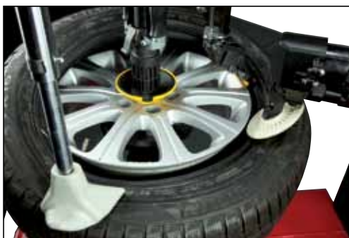
Premitallone pneumatico/Pneumatic bead pressing tool

An extensive range of optional accessories are available to meet all the needs of industry professionals.