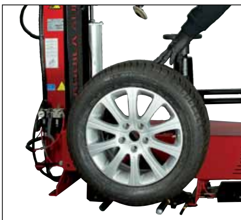
Kit Sollevatore ruota / Wheel lift