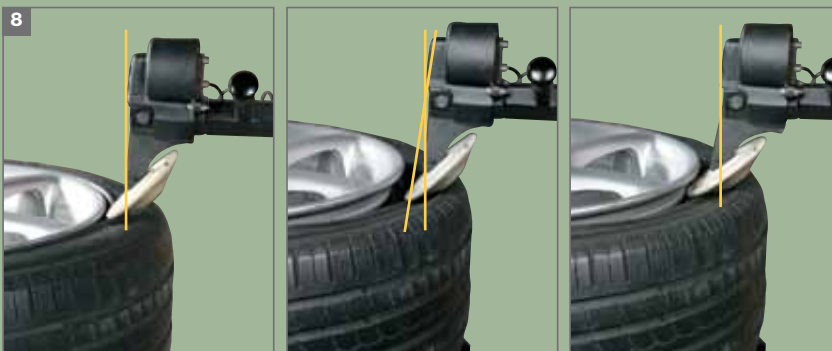
8. Sistema di penetrazione controllata per semplificare la stallonatura delle ruote più impegnative (Patent Pending) Controlled penetration system to simplify bead breaking jobs with more difficult wheels (Patent Pending)