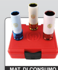
MAT. DI CONSUMO

Le unità FRL aumentano la produttività e durata degli utensili CP.